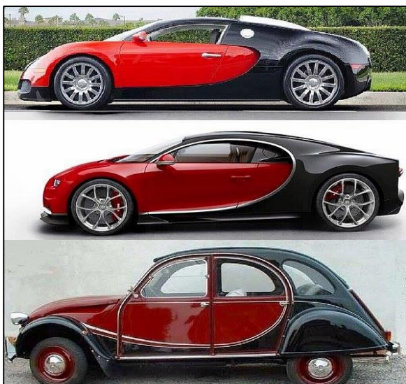
Veyron, Chiron, Charleston...

• En complément à notre précédent article sur le moteur à taux de compression variable développé par Infiniti, en voici une explication en vidéo : https://www.youtube.com/watch?v=3rn-gZNIU