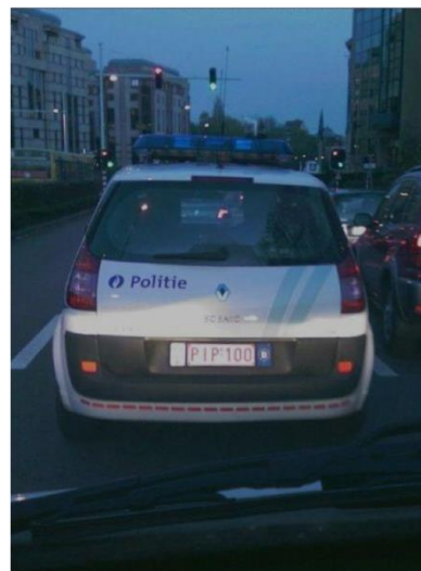
Qu'aurait dit Magritte ?