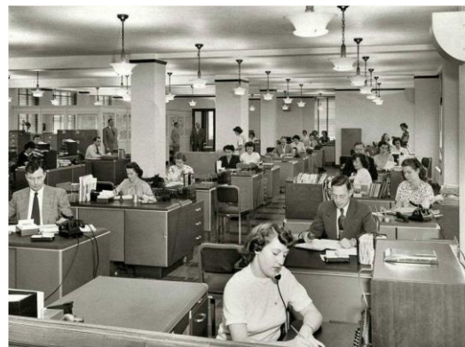
Een grote verzekeringsmaatschappij in 1949