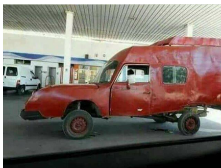
Eerste Britse wagen van na de Brexit