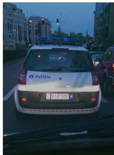
Wat zou Magritte hiervan vinden ?