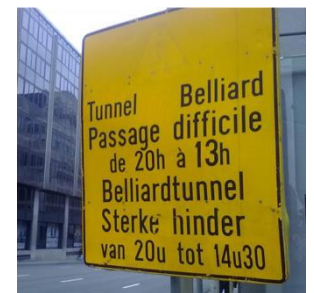
Wat is het nu ?