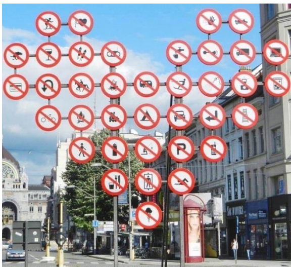
Wanneer je binnen 10 jaar Brussel binnenrijdt